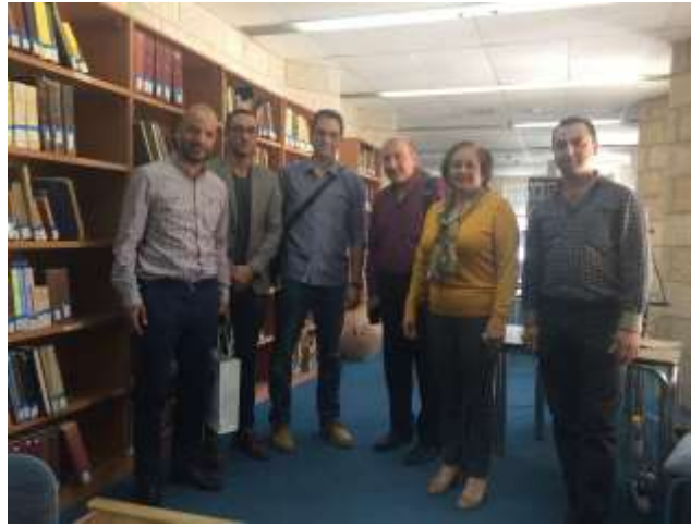
المختبر المفتوح في القاعة الرئيسية للمكتبة

كما اقتنت المكتبة إنتاجه الحديث، من إصدار العام 2019 وهو موسوعة "Encyclopedia Palestinnica" لتعتبر مكتبة جامعة بيرزيت أيضاً أول مكتبة محلية تقتني الإصدار حال صدوره ، وتتكون الموسوعة من 24 جزءاً من 7000 صفحة، وتشتمل على 30 ألف رسمة وصورة ووثيقة وخريطة عن فلسطين، وتعتبر "أضخم عمل أكاديمي صدر عن فلسطين" كما ذكر.