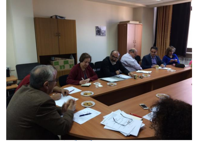
جانب من ورشة كلية الآداب