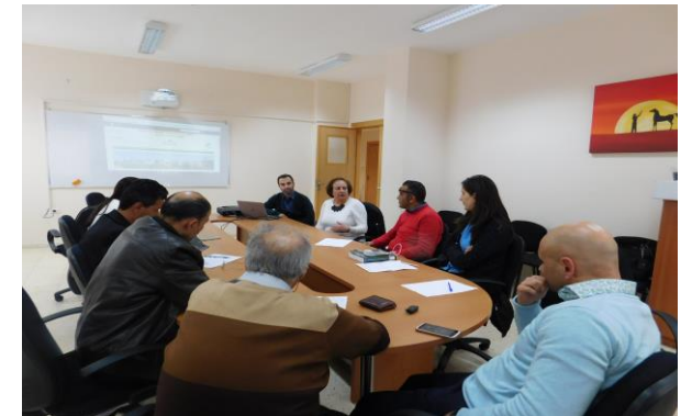
جانب من ورشة كلية التمريض