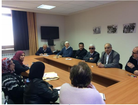
دائرة اللغة العربية